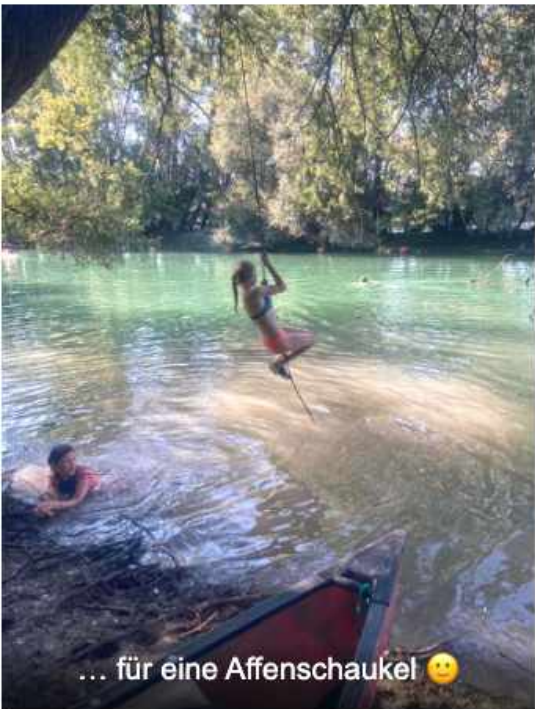
... für eine Affenschaukel 🙄