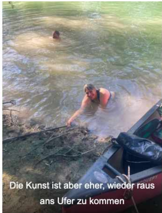
Die Kunst ist aber eher, wieder raus ans Ufer zu kommen