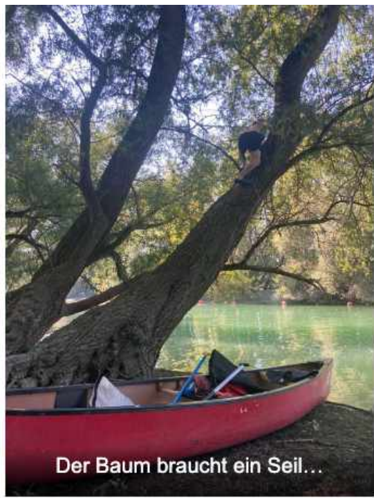
Der Baum braucht ein Seil...